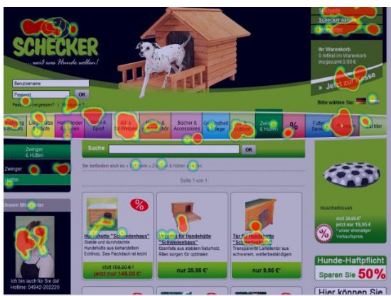
www.schecker.de mit Click Monitor Heat Map

Der geringe Aufwand hat das Schecker Team überzeugt. Aber auch die intuitive Bedienbarkeit der Software sorgte für eine kurze Einarbeitungszeit, so dass der Einsatz der econda Lösungen von Anfang an zur vollsten Zufriedenheit verlief.