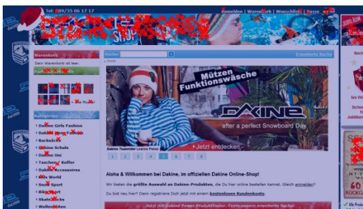
Website dakine-shop.de mit econda Click Map

Neben der Analyse des Online-Shops steht bei dakine-shop.de die präzise Erfolgskontrolle des wöchentlichen Newsletters im Fokus.