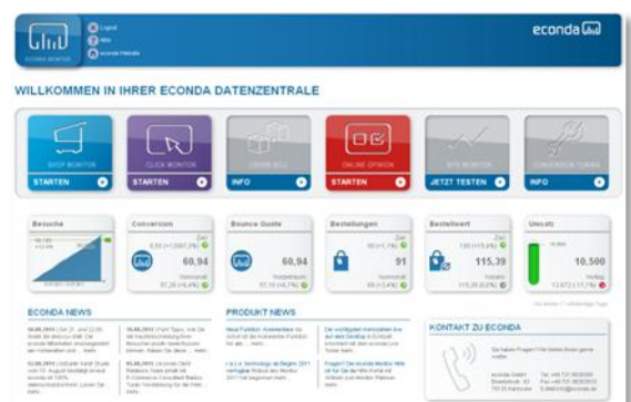
E-Commerce Datenzentrale von econda mit FACT-Finder Plug-In