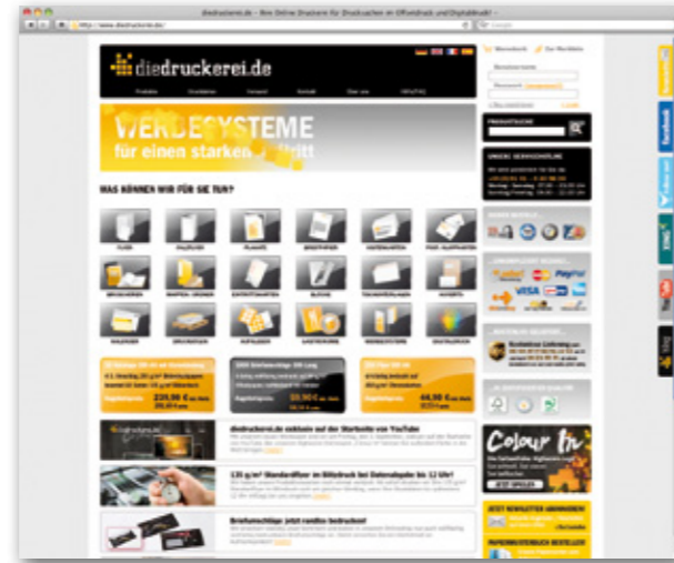
Website diedruckerei.de der onlineprinters GmbH

Um die Besucher besser zu verstehen, entschied sich die Onlineprinters GmbH schließlich für die econda Produkte Shop Monitor und Click Monitor. Den Ausschlag für die Entscheidung für die High-End Web-Analyse-Software gab nicht zuletzt das gute Preis-Leistungs-Verhältnis. Daneben bestechen die econda Produkte durch den funktionellen Umfang und leichte