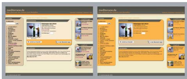
Welche Farbeinstellung konvertiert besser?